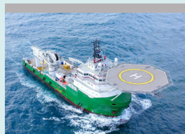
Marina - Offshore