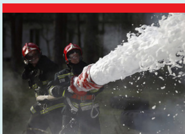
Vigili del fuoco - Autopompe