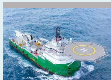
Marina - Offshore