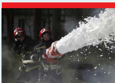
Vigili del fuoco - Autopompe