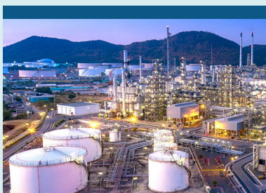
Teollisuus - Sprinklaus

Taloudellinen ja ympäristöystävällinen testaus optiona tarjottavalla DRV venttiilillä ja kahdella erillisellä virtausmittarilla.