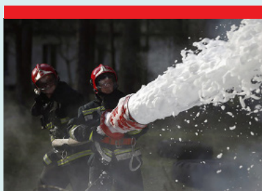
Palokuntiin - Paloautoihin