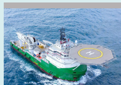
Merenkulkuun - Avomerelle